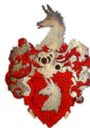
Personvåpen for Ludvig Holberg og slektsvåpen for von Ahnen