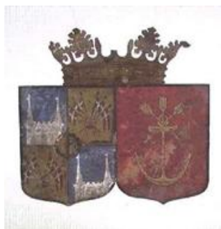
Alliansevåpen med de to skjoldene Wedel Jarlsberg & Anker under en skadet grevekrone