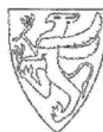
To middelaldersegl fra Bjarkøyætten som ga ideen til skjoldet med griffen i fylkesvåpenet for Troms, tegnet av Hallvard Trætteberg i hans karakteristiske stil