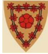
Audun Hagleiksons ryttersegl fra middelalderen og en moderne tegning av skjoldet