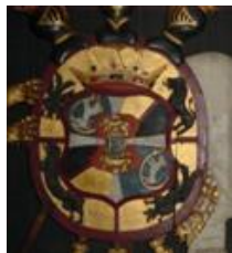
Våpen Danneskiold-Laurvig med elementer fra Ulrich Friderich Gyldenløves våpen