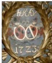
Alliansevåpen Krefting & Vogt fra 1723 på prekestolen i Tanum kirke i Bærum